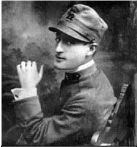
Totò mobilisé, en 1918

À l'école primaire Totò fut puni par son professeur par un coup de poing à la mâchoire. Ce coup la lui déboîta jusqu'à sa mort, ce qui explique sa mâchoire de travers tout au long de sa carrière.